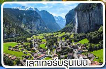
เลาเคอร์บรุนเนน