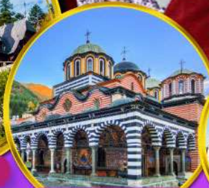
อารามมรดกโลกริล่า