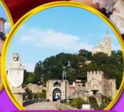
ป้อมชาเรเวทส์