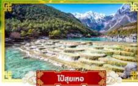
ไป๋สุ่ยเหอ