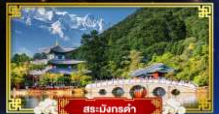
สระมิงกรคำ