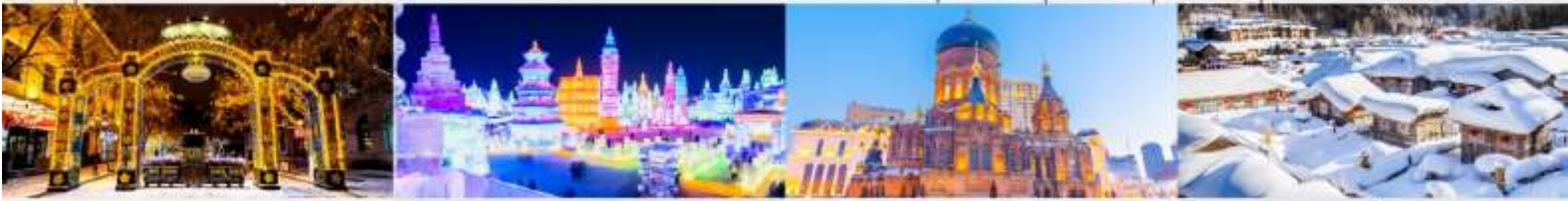
ถนนคนเดินจงหยาง เทศกาลคอมไฟน้ำแข็ง โบสถ์เซนต์โซเฟีย หมู่บ้านหิมะ

*ทางบริษัทฯ ขอสงวนสิทธิ์ในการสลับโปรแกรมทัวร์ตามความเหมาะสมขึ้นอยู่กับสถานการณ์ปัจจุบัน โดยคำนึงถึงผลประโยชน์ของลูกค้าเป็นสำคัญ