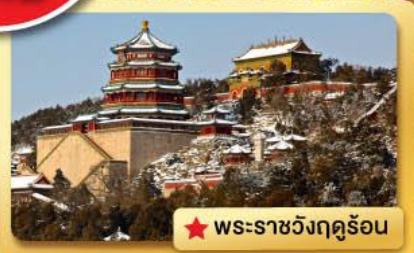
★ พระราชวังฤดูร้อน