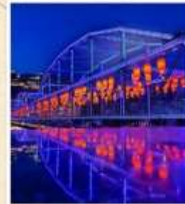
สะพานหวงเหอ ตี้อี้เจียว