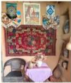
หมู่บ้านอุยกูร์