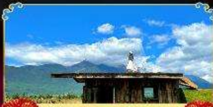
กาแฟ Yun Ti Yang