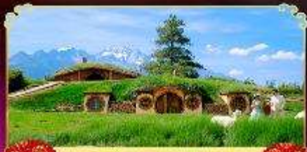
สวนทิงฮวาถู่

ชมความยิ่งใหญ่ยอดเขาควาเกโปแห่งภูเขาหิมะลี่