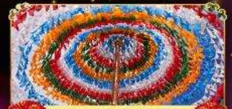
รงมนต์อธิษฐาน