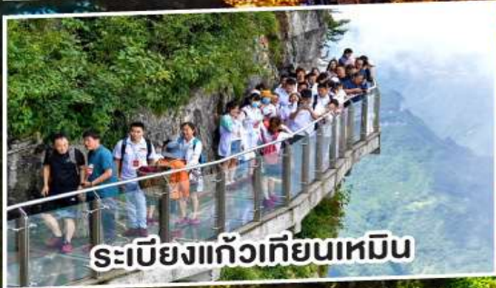
ระเบียงแก้วเทียนเหมิน