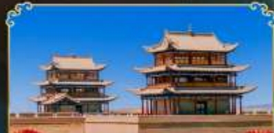
กำแพงเมืองจีนเจียวอวี่กวน