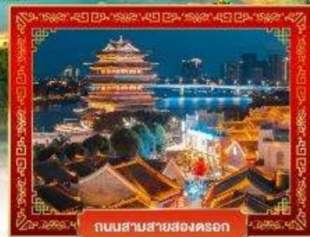
ถนนสามสายสองตึก