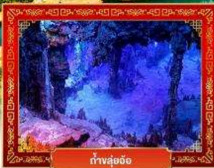
ถ้ำลู่อ้อ