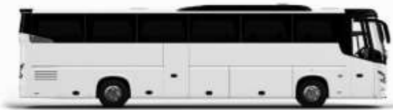
ตัวอย่างรถทัวร์ 1 คัน

ค่าที่พักตามที่ระบุในรายการหรือเทียบเท่าระดับเดียวกัน (ห้องพักละ 2 ท่าน) หากประเภทห้องพักท่านริเวรสนาเดิม อาทิ เช่น ริเวรสห้องพักเป็น TWIN BED หรือ DOUBLE BED ทางบริษัทขอสงวนสิทธิ์ในการปรับประเภทห้องพัก เป็นตามที่โรงแรมมีอยู่ โดยไม่ต้องแจ้งให้ทราบล่วงหน้า