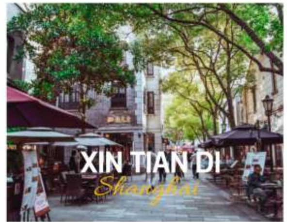
XIN TIAN DI Shanghai

ย่านใหม่ใจกลางเมืองเซี่ยงไฮ้ อีก 1 ย่านช้อปปิ้งและร้านอาหาร ร้านอาหารที่มีเอกลักษณ์ จากสถาปัตยกรรมที่ใช้อิฐบล็อกแบบสถาปัตยกรรมชิคเก๋มึน ซึ่งเป็นการผสมผสานกันระหว่างสถาปัตยกรรมจีนกับตะวันตกเข้าด้วยกัน ท่านจะพบกับทางเดินหิน กำแพงหิน ประติมากรรมที่มีเอกลักษณ์ โดย 2 ทางของถนนมีต้นเมเปิ้ลตลอดทาง ยิ่งทำให้ย่านนี้มีเสน่ห์เพิ่มเป็นเท่าตัว