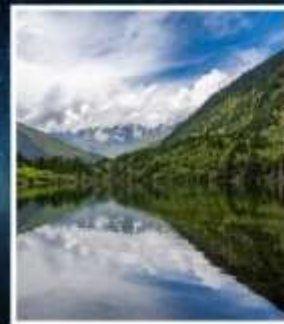
อุทยานมู่เก้อจิว