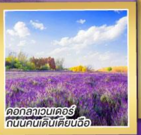
ดอกลาเวนเดอร์ ถนนคนเดินเตียนอื่อ