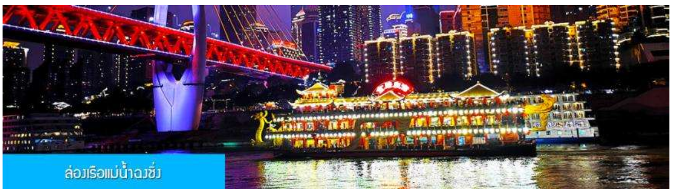
ล่องเรือแม่น้ำจิว