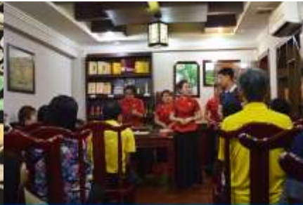
ร้านใบชา