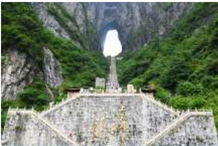
ประตูสวรรค์