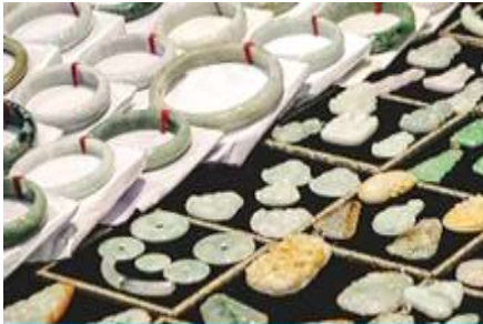
ศูนย์จำหน่ายผลิตภัณฑ์หยก

หลังอาหารเช้าท่านเดินทางเข้าที่พัก หรือท่านสามารถเลือกซื้อ โปรแกรมเสริม เป็นบัตรชมการแสดง ชุด The Love Story of a Wooden man and Fairy fox หรือที่เรียกกัน ในหมู่นักท่องเที่ยวไทยว่า โซว์จิ้งจอกขาว เป็น การแสดงกลางแจ้งที่ทุ่มทุนสร้างอย่างสุดอลังการ เป็นการแสดงที่น่าดูชมที่สุดในเมืองจางเจียเจีย การแสดงชุดนี้ ใช้ภูเขาประติมากรรมเป็นฉากหลังประกอบการแสดง ซึ่งให้ความรู้สึกสมจริงเหมือนผู้ชมและนักแสดงอยู่ท่ามกลางธรรมชาติ ใช้ทีมงานนักแสดงหลายร้อยคน พร้อมระบบแสง สี เสียงที่ทันสมัยประกอบการแสดง อัตราค่าบริการสำหรับโปรแกรมเสริมการแสดงชุด The love Story of Wooden man and Fairy Fox ท่านละ 400 หยวน (หรือ 2,000 บาทขึ้นอยู่กับอัตราแลกเปลี่ยน) ระยะเวลาที่ใช้ในการเที่ยวชมการแสดง ประมาณ 3 ชั่วโมง รวมเวลาเดินทางไป กลับค่าบริการรวม ค่าบัตรเข้าชม ค่ารถรับ ส่ง และค่าน้ำดื่มของไกด์ท้องถิ่น พักที่ ZHENMIAN HOTEL โรงแรมระดับ 4 ดาวหรือเทียบเท่า