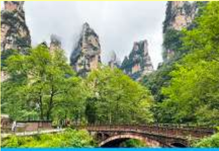
จุดชมวิวจินเปียนซี

จินเปียนซีที่สามารถมองเห็นวิวยอดเขาอวตารได้ชัดเจน นำท่านเที่ยวชมจุดชมวิวดู ฉ ลานชมวิวน้ำลิฟท์แก้วไป หลังที่สามารถมองเห็นทัศนียภาพของภูเขาอวตารและลิฟท์แก้วได้ชัดเจน ( ไม่ได้รวมค่าขึ้นลิฟท์แก้ว) อัตรา ค่าบริการรวม ค่าบัตรเข้าอุทยาน ค่ารถรับส่งภายในเขตอุทยาน ค่าน้ำดื่มของไกด์ท้องถิ่น