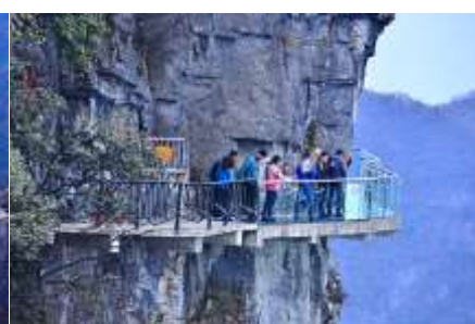
หน้าผาลอยฟ้าทางเดินกระจก