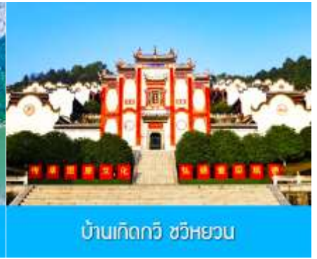
บ้านเกิดกวี ขวี่หยวน