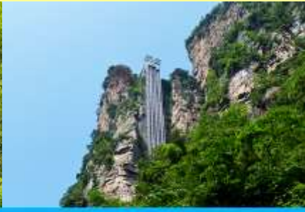
ลิฟท์แก้วไปหลวม