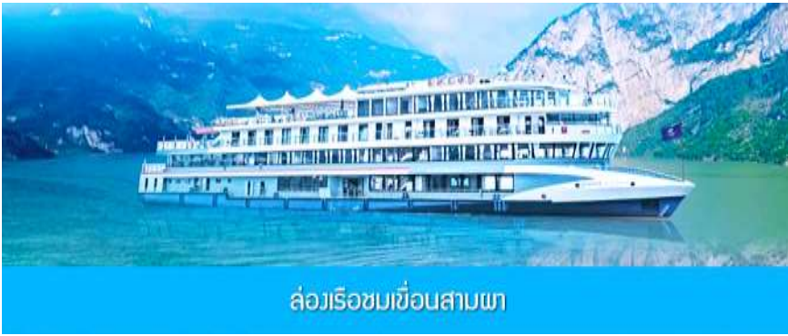
ล่องเรือชมเขื่อนสามผา