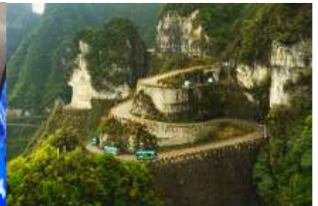
เส้นทาง 99 โค้ง