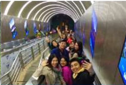
บันไดเลื่อนทะเลภูเขา