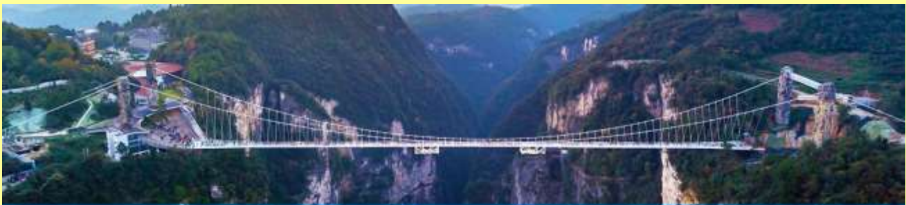
สะพานกระจกข้ามหุบเขาแกรนด์แคนยอน

โปรแกรมเสริมที่ 2 โปรแกรมเที่ยวชมอุทยานภูเขาอวตารแบบครึ่งวันที่รวมค่าขึ้นลิฟท์แก้ว (ผู้เข้าร่วมขั้นต่ำ 15 ท่าน) ใช้เวลาประมาณ 4-6 ชั่วโมง (ขึ้นอยู่กับจำนวนนักท่องเที่ยวในแต่ละวัน) อัตราค่าบริการท่านละ 750 หยวนหรือ 3,750 บาท นำท่านเที่ยวชมจุดชมวิวลำธารจินเปียนซีที่สามารถมองเห็นวิวยอดเขาอวตารได้ชัดเจน นำท่านเที่ยวชมจุดชมวิวดู ฉ ลานชมวิวน้ำลิฟท์แก้วไปหลังที่สามารถมองเห็นทัศนียภาพของภูเขาอวตารและ ลิฟท์แก้วได้ชัดเจน นำท่านขึ้นลิฟท์แก้วขึ้นสู่ยอดเขาอวตาร นำท่านเดินชมจุดชมวิวดูต่าง ๆ บนยอดเขาอวตาร ได้แก่ภูเขาฮาเลลูย่า สะพานหนึ่งโนได้หล้า... อัตราค่าบริการรวม ค่าบัตรเข้าอุทยาน ค่ารถรับส่งภายในเขตอุ ทยาน ค่าน้ำดื่มของไกด์ท้องถิ่น