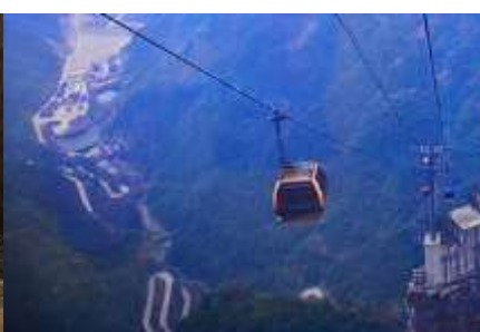
กระเช้าขึ้นเทียนเหมินซาน