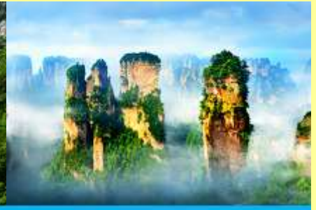
ภูเขาอวตาร

โปรแกรมเสริมที่ 2 โปรแกรมเที่ยวชมอุทยานภูเขาอวตารแบบครึ่งวันที่รวมค่าขึ้นลิฟท์แก้ว (ผู้เข้าร่วมขั้นต่ำ 15 ท่าน) ใช้เวลาประมาณ 4-6 ชั่วโมง (ขึ้นอยู่กับจำนวนนักท่องเที่ยวในแต่ละวัน) อัตราค่าบริการท่านละ 750 หยวนหรือ 3,750 บาท นำท่านเที่ยวชมจุดชมวิวลำธารจินเปียนซีที่สามารถมองเห็นวิวยอดเขาอวตารได้ชัดเจน นำท่านเที่ยวชมจุดชมวิวดู ฉ ลานชมวิวน้ำลิฟท์แก้วไปหลังที่สามารถมองเห็นทัศนียภาพของภูเขาอวตารและ ลิฟท์แก้วได้ชัดเจน นำท่านขึ้นลิฟท์แก้วขึ้นสู่ยอดเขาอวตาร นำท่านเดินชมจุดชมวิวดูต่าง ๆ บนยอดเขาอวตาร ได้แก่ภูเขาฮาเลลูย่า สะพานหนึ่งโนได้หล้า... อัตราค่าบริการรวม ค่าบัตรเข้าอุทยาน ค่ารถรับส่งภายในเขตอุ ทยาน ค่าน้ำดื่มของไกด์ท้องถิ่น