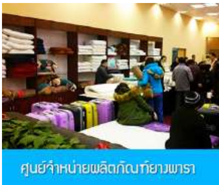
ศูนย์จำหน่ายผลิตภัณฑ์ยางพารา

พักที่ ZHENMIAN HOTEL OR YINXIANG HOTEL ระดับ 4 ดาวท้องถิ่นหรือเทียบเท่าในเมืองจางเจียเจี๋ย