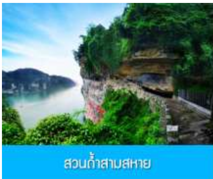
สวนถ้ำสามสหาย