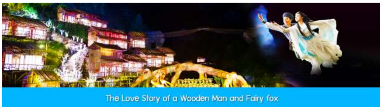
The Love Story of a Wooden Man and Fairy fox

เนื่องจากอุทยานเทียนเหมินซานมียอดจองตั๋วล่วงหน้าที่น่าแน่นในช่วงฤดูท่องเที่ยวและช่วงวันหยุดยาวของจีน ทางผู้จัดทัวร์ขอสงวนสิทธิ์ในการจัด โปรแกรมเที่ยวภูเขาเทียนเหมินซานได้ทั้งแบบ Route A และ Route B ทั้งนี้ขึ้นอยู่กับความซ้ำเร็วในการส่งข้อมูลส่วนตัว(หน้าพาสปอร์ต)ในการจองตั๋วล่วงหน้าของแต่ละคณะ