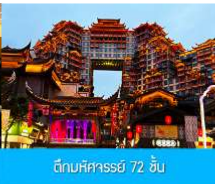
ตึกมหัศจรรย์ 72 ชั้น