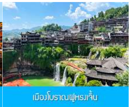
เมืองโบราณฝูหรงเจิน

วันที่สาม เมืองจางเจียเจี๋ย-ศูนย์จำหน่ายผลิตภัณฑ์ยางพารา-ตึกมหัศจรรย์ 72 ชั้น-เมืองโบราณฝูหรงเจินยามค่ำคืน