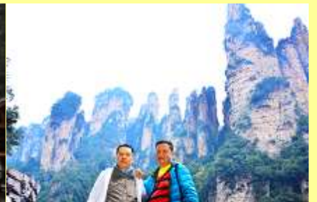
ชมจุดชมวิวลีเฟ็ก้าว

โปรแกรมเสริมที่ 1 โปรแกรมเที่ยวชมอุทยานภูเขาอวตารแบบสั้นที่ไม่ขึ้นลิฟท์แก้ว (ผู้เข้าร่วมขั้นต่ำ 15 ท่าน) ใช้เวลาประมาณ 2-3 ชั่วโมง อัตราค่าบริการท่านละ 400 หยวนหรือ 2,000 บาท นำท่านเที่ยวชมจุดชมวิวลำธาร