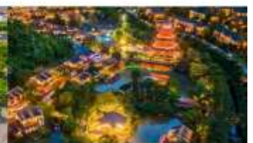
หมู่บ้านเกอเซียน

*ทางบริษัทฯ ขอสงวนสิทธิ์ในการสลับโปรแกรมทัวร์ตามความเหมาะสมขึ้นอยู่กับสถานการณ์หน้างาน โดยคำนึงถึงผลประโยชน์ของลูกค้าเป็นสำคัญ