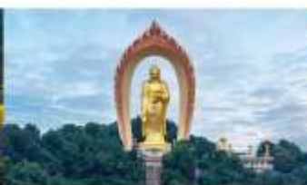
พระใหญ่ตงหลิน