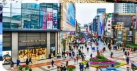
ถนนคนเดินชุนซีถู๋