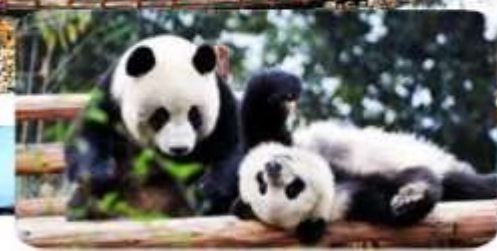
ศูนย์วิจัยหมีแพนด้า

เมนูพิเศษ สุกี้หม่าล่า บุฟเฟต์ / เปิดชกกึ่ง