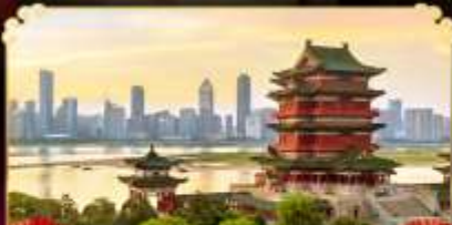
หอถึงหวังเก้อ