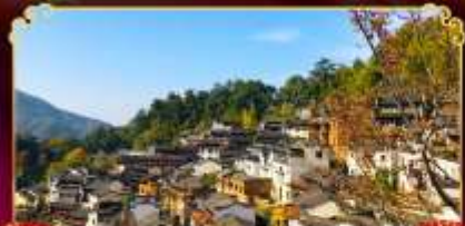
หมู่บ้านทวงหลิง

หมู่บ้านริมผา "หมู่บ้านเทวดาวังเซียนกู่" เจาสวรรค์ซานซิง มรดกโลกสุดงดงามแดนมังกร