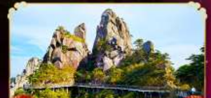
เจาซานซิงซาน