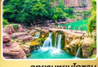
อุทยานหยุ่นโกซ่าน