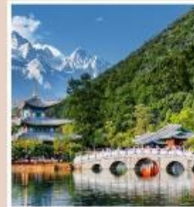
สะพานมังกรดำ