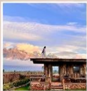
YUN DI AN CAFE