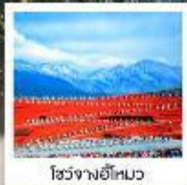
โจวจางฮือหมว