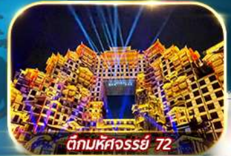
ตึกมหัศจรรย์ 72

เต็มอิ่มกับบรรยากาศเมืองโบราณเฟิ่งหวง เขาเทียนเหมินซาน ประตูลั่ว หมู่บ้านโบราณบนน้ำตกฟุรงเจิน