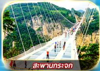
สะพานกระจก