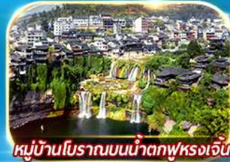
หมู่บ้านโบราณบนน้ำตกฟุรงเจิน