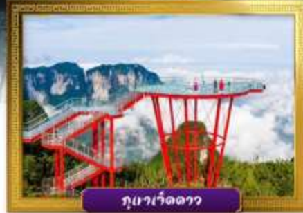
ภูเวาเว็ดดาว