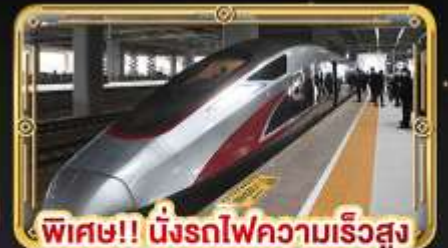
พิเศษ!! นั่งรถไฟความเร็วสูง