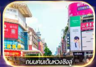
ถนนคนเดินหวงซิงสู๋

ล่องเรือชมเมืองโบราณ ฟุรงเจิน + ทะเลสาบเป่าเฟิงหู