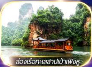
ล่องเรือทะเลสาบเป่าเฟิงหู