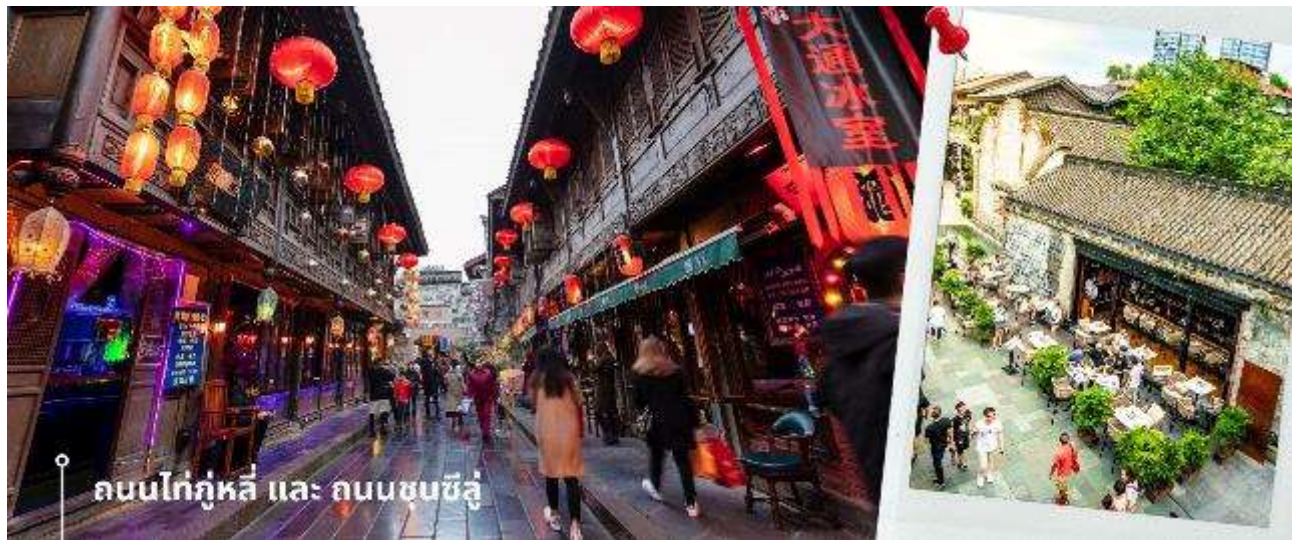
ถนนไท่กุ่หลี่ และ ถนนชุนซีลู่

จากนั้นให้ท่านให้อิสระกับการเลือกซื้อสินค้าของฝากที่ ถนนไท่กุ่หลี่ และ ถนนชุนซีลู่ ในย่านนี้เป็นถนนโบราณ ในอดีตเคยโรงงานผลิตผ้าไหมใหญ่ที่สุดในจีน ปัจจุบันได้เปลี่ยนเป็นถนนช้อปปิ้งแหล่งสวรรค์ของนักท่องเที่ยว เป็นถนนคนเดิน มีห้างสรรพสินค้าชื่อดัง มีร้านค้ามากกว่า 700 ร้านค้าที่เต็มไปด้วยสินค้าต่าง ๆ ทั้งร้านค้าแฟชั่น ร้านอาหารและโรงแรมนานาชาติมากมายซึ่งเป็นที่ยอดนิยมที่มีการเชื่อมต่อทางวัฒนธรรมท้องถิ่นที่เป็นแหล่งช้อปปิ้งและเป็นแหล่งร้านอาหารที่อร่อยต่าง ๆ มากมาย ซึ่งเป็นสถานที่เที่ยวของเฉิงตูที่ทำให้เพลิดเพลินกับสินค้าแบรนด์เนมและแบรนด์จีน เพื่อให้นักท่องเที่ยวได้เลือกซื้อตามอิสระ แะร้าน POP MART