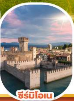
ซิริมีโอเน