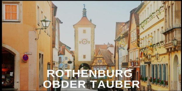
ROTHENBURG OBDER TAUBER