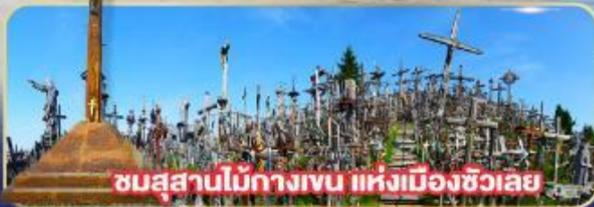
ชมสุสานไม้กางเขน แห่งเมืองซีวเลย์