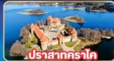
ปราสาทคราโด

พิเศษ! เที่ยวเก็บครบทุกประเทศยุโรปเหนือ ลิตัวเนีย , ลัตเวีย , เอสโทเนีย , ฟินแลนด์