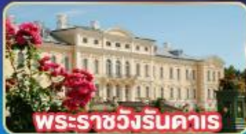
พระราชวังรินคาส