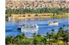
พักผ่อนตามอัธยาศัย บนเรือสำราญ

** พักที่ Royal Beau Rivage Nile cruise 5* หรือเทียบเท่า **