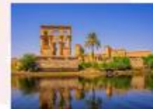
วิหารฟิเล

16.25 น. ออกเดินทางสู่กรุงไคโร สายการบิน Egypt Airlines เที่ยวบิน MS295