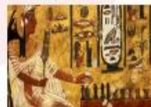
พิพิธภัณฑ์สถานแห่งชาติอียิปต์