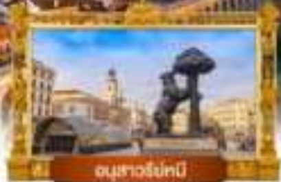
อนุสาวรีย์หนี

เมนู พิเศษ! จิวเวลีลเปเน + คุยกับอับเลื่องชื่อ