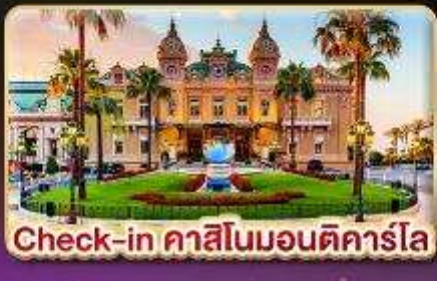
Check-in คาสีโนมอนติคาร์โล