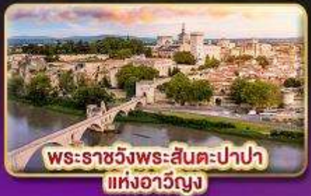
พระราชวังพระสันตะปาปา แห่งอาวีญง