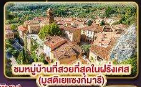
ชมหมู่บ้านที่สวยงามที่สุดในฝรั่งเศส (มูสติเยแซงก์มาร์)