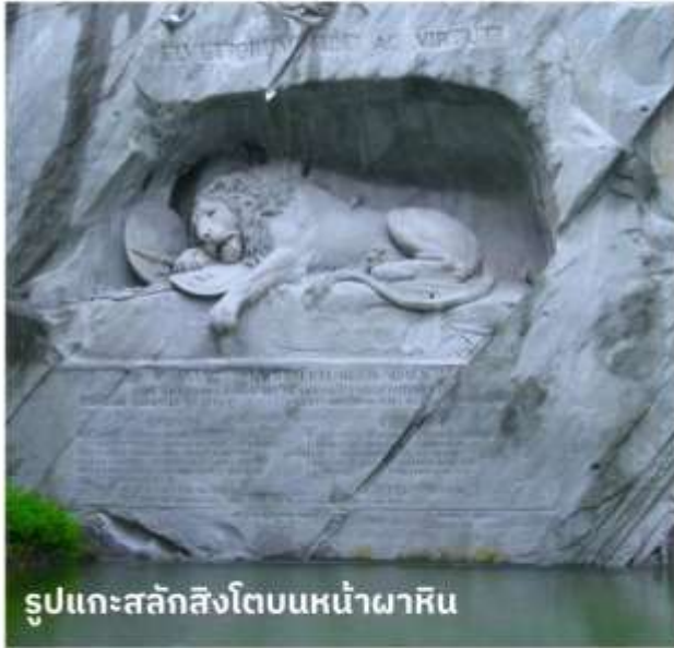
รูปแกะสลักสิงโตบนหน้าผาหิน

จากนั้นนำท่านเดินทางสู่ เมืองแองเกิลเบิร์ก เพื่อนั่งกระเช้าหิมะแห่งแรกของโลกสู่ ยอดเขาคัทลิส (TITLIS) แหล่งเล่นสกีของสวิทเซอร์แลนด์ภาคกลาง ที่หิมะคลุมตลอดทั้งปี สูงถึง 10,000 ฟุต หรือ 3,020 เมตร บนยอดเขาแห่งนี้หิมะจะไม่ละลายตลอดทั้งปี นั่งกระเช้ายักษ์ที่หิมะได้รอบทิศเครื่องแรกของโลกที่ชื่อว่า REVOLVING ROTAIR จนถึงสถานีบนยอดเขาคัทลิส