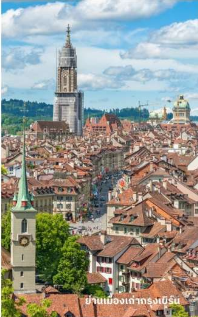
ย่านเมืองเก่ากรุงเบิร์น

นำท่านลัดเลาะชม ถนนจุงเคอร์นกาสเซ ถนนที่มีระดับสูงสุดของเมืองนี้ ซึ่งเต็มไปด้วยร้าน ภาพวาดและร้านขายของเก่าในอาคารโบราณ