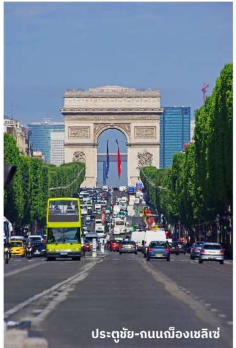
ประตูชัย-ถนนฌ็องเซลิเซ่

จากนั้นนำท่านเดินทางท่องเที่ยวตามสถานที่ที่มีชื่อเสียงของกรุงปารีส