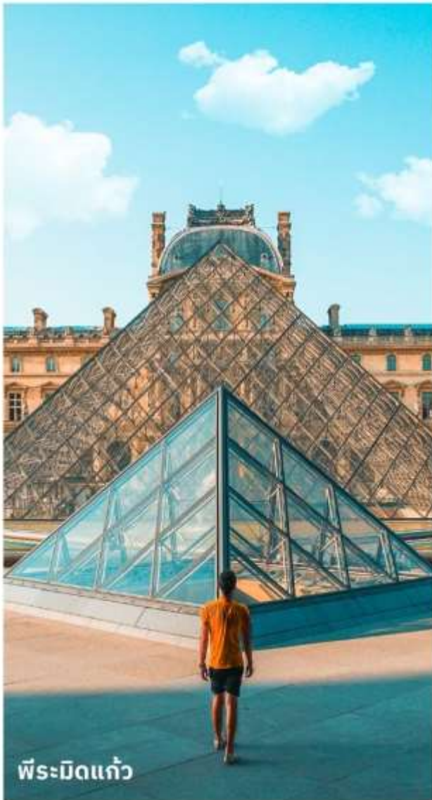
พีระมิดแก้ว

เดินทางสู่ พิพิธภัณฑ์ลูฟร์ ให้ท่านได้ถ่ายรูปด้านหน้า พีระมิดแก้วของพิพิธภัณฑ์ลูฟร์ เป็นพิพิธภัณฑ์ทางศิลปะที่มีชื่อเสียงที่สุด เก่าแก่ที่สุดและใหญ่ที่สุดแห่งหนึ่งของโลก