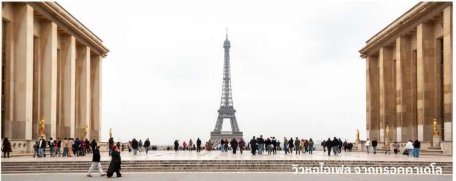
วิวหอไอเฟล จากทรอคคาเดโร