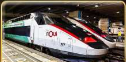
นั่งรถไฟความเร็วสูง PARIS - LYON