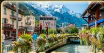
เยือนชาโมนิกซ์ พิชิตมงบลังก์