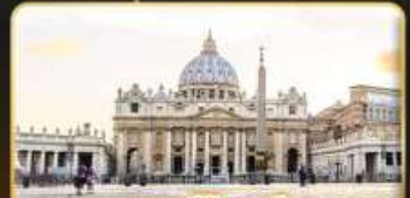
เซนต์ปีเตอร์