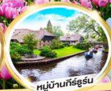
หมู่บ้านกิร์ธูร์น