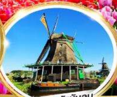
หมู่บ้านกังหันลม