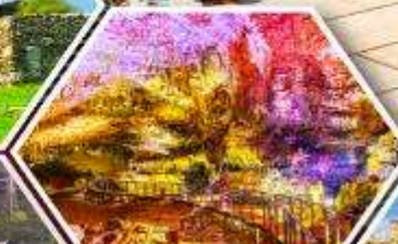
ตัดไฟรมีริอุส