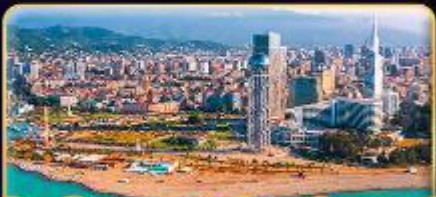
ส่องเรือทะเลสาบค้ำชมอ่าวบาตูมิ