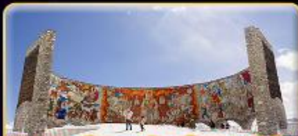
อนุสรณ์สถานรัสเซีย-จอร์เจีย