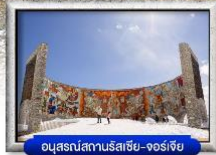
อนุสรณ์สถานรัสเซีย-จอร์เจีย