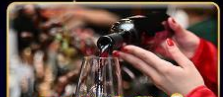
พิเศษ!! ซิมไวน์ท้องถิ่น