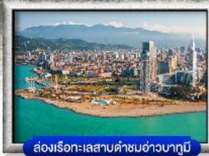
ส่องเรือทะเลสาบคำชมอ่าวบากูมี