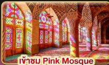
เข้าชม Pink Mosque