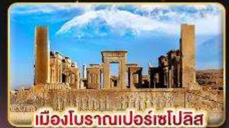
เมืองโบราณเปอร์เซโปลิส

✈️ บินตรง กรุงเทพฯ - เตหะราน บินภายใน ชีราซ - เตหะราน