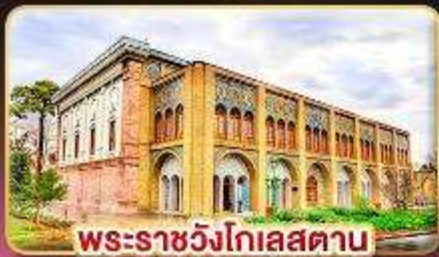
พระราชวังโกเลสถาน

เยือนอารยธรรมเปอร์เซีย เก็บครบทุกไฮไลต์สำคัญ