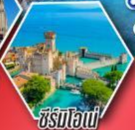
ซีร์มิโอเน่