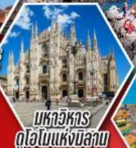
มหาวิหาร ดูโอโมแห่งมิลาน