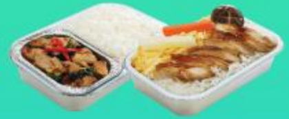
บริการอาหารร้อนบนเครื่องบิน มาไป - ชากลับ