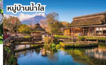
หมู่บ้านน้ำใส