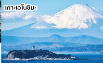
เกาะเอโนชิมะ

DON'T WORRY, WE TAKE CARE YOU ✓ ราคารวมทุกอย่างไม่ต้องจ่ายเพิ่ม!! ✓ ทารินดีครบ 10 ท่าน ออกเดินทางแน่นอน ✓ สายการบินประจำชาติ Full Service ✓ ที่พักท่าเลดี มีมาตรฐาน 4 ดาวขึ้นไป ✓ โทดมีออาชิฟูดแผลดลอด ✓ ไม่บังคับทิปโทด ✓ รวมประกันอุบัติเหตุ ✓ มีน้ำดื่มบริการทุกวัน ✓ มีอินเทอร์เน็ตบริการบนรถบัส