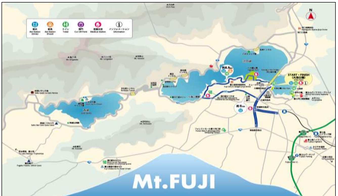
Map_Charity Fun-Run 10.5 Km.