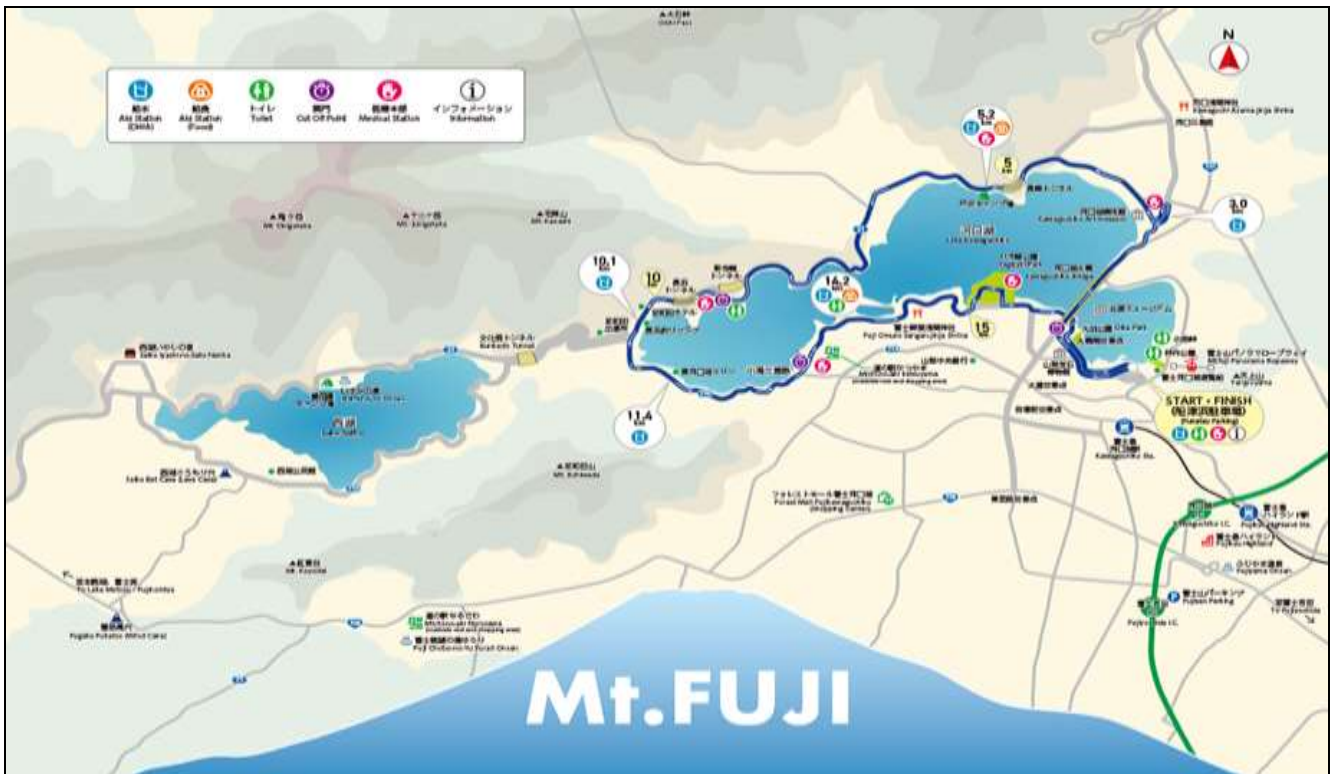
Map_Around Kawaguchi Lake 17 Km.