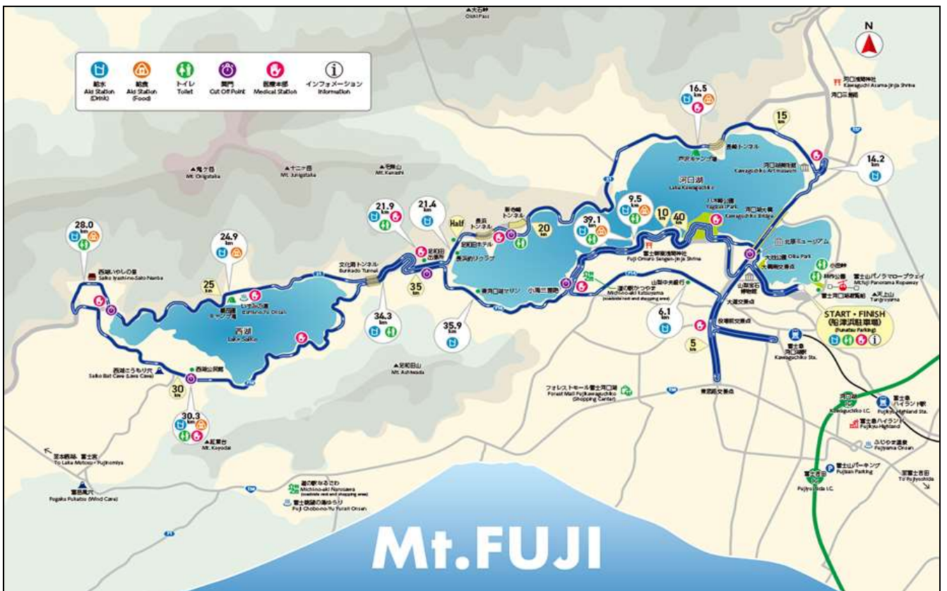
Map_Full Marathon 42 Km.