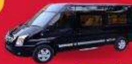
VAN (7-8 ท่าน)

สำหรับท่านที่ต้องการความเป็นส่วนตัวมากขึ้น ท่านสามารถเลือกใช้บริการ รถส่วนตัวได้ โดยมีรูปแบบรถให้เลือกถึง 2 ประเภท โดยรถ แต่ละประเภท สามารถนั่งได้ตั้งแต่ 2 ท่านขึ้นไป