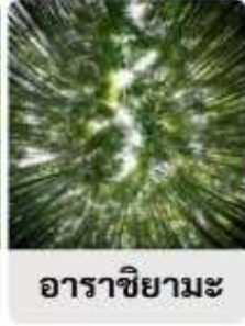
อาราชิยามะ