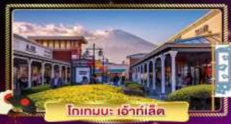
โทกอนะ เอ้าท์เล็ต