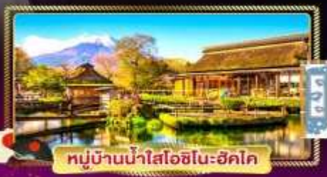
หมู่บ้านน้ำใสโอชิโนะฮิโค