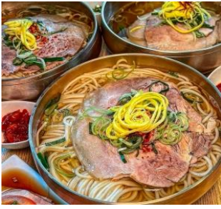
อาหารกลางวันบริการท่านด้วย ก๋วยเตี๋ยวเซจู เป็นอาหารท้องถิ่นของเกาะเจจู