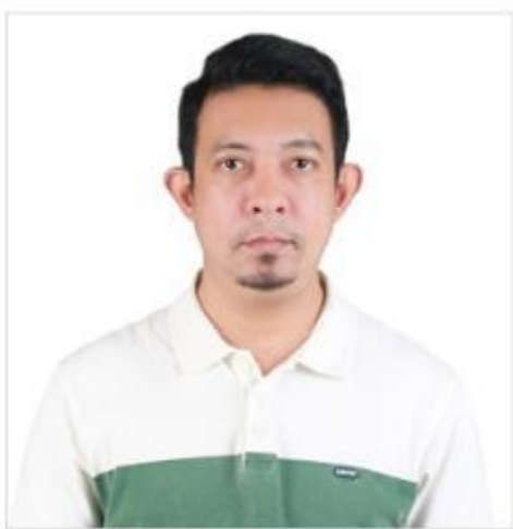
( ตัวอย่างรูปถ่าย )