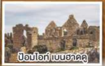
ป้อมโอ๊ก เบนฮาดดู