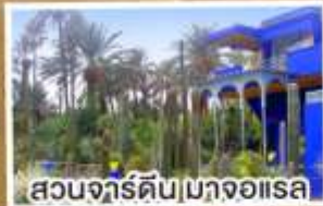
สวนจาร์ดิน|มาจออเรล

14-23 มี.ค. 68 23 เม.ย.-02 พ.ค. 68 02-11 พ.ค. 68