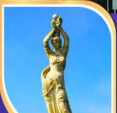
จูไห่พิซเซอร์เก็ร่า