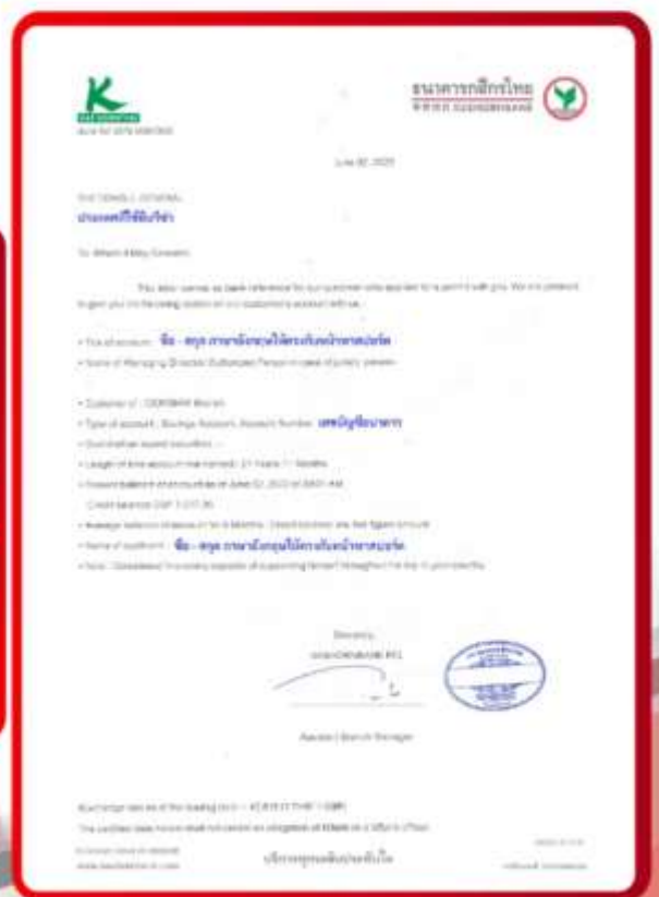
ตัวอย่าง Bank Guarantee ที่ผู้สมัครต้องขอจากธนาคาร