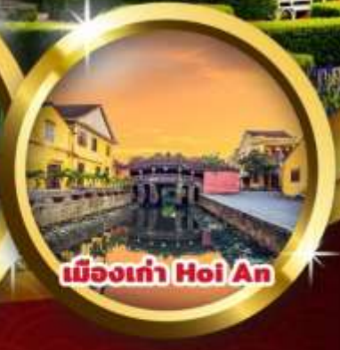
เมืองเก่า Hoi An